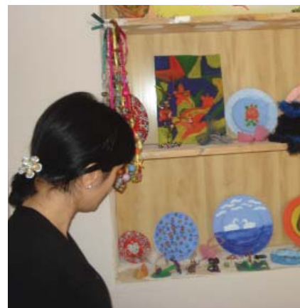
Выставка детских изделий в Озургети