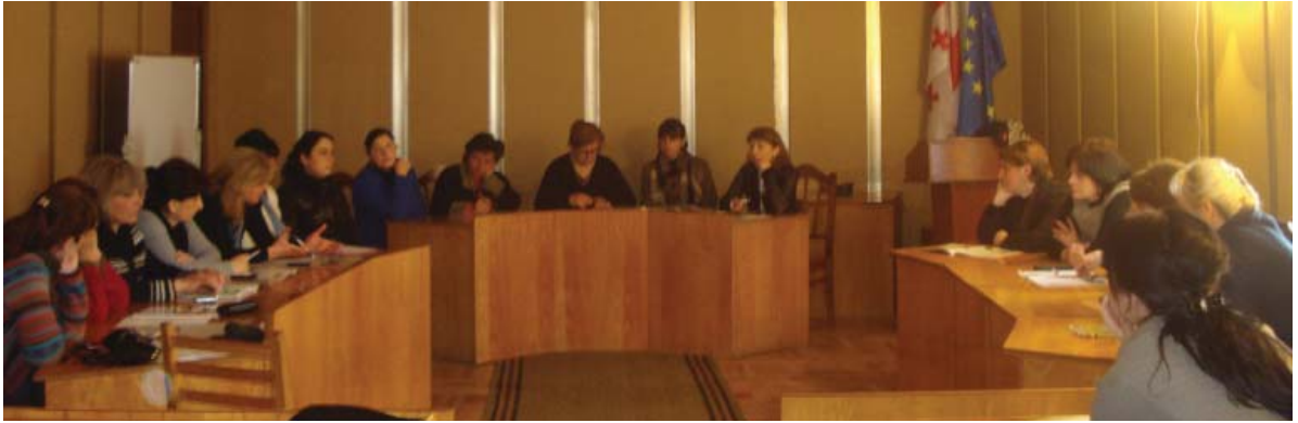
Клуб женщин-избирательниц собрался в озургетском сакребуло

быть членом какой-либо партии. Как журналист я всегда старалась быть беспристрастной и объективной.