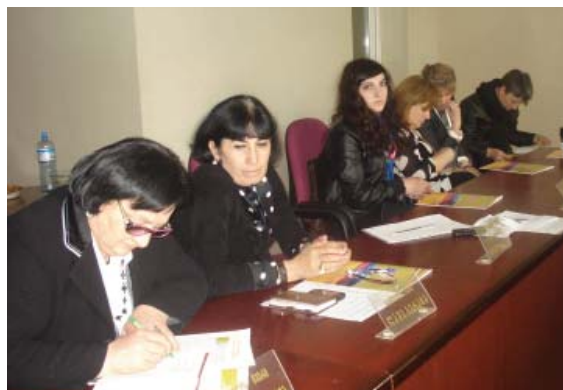
Встреча в Поти