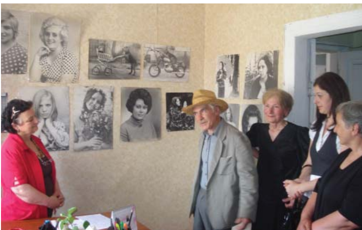
Фотовыставка в Хоби

Члены озургетского, хонского и кутаисского клубов приехали в Цхалтубо, ознакомили друг друга с работой и поделились своим опытом. Они осмотрели курортный город, были на известном шестом источнике.