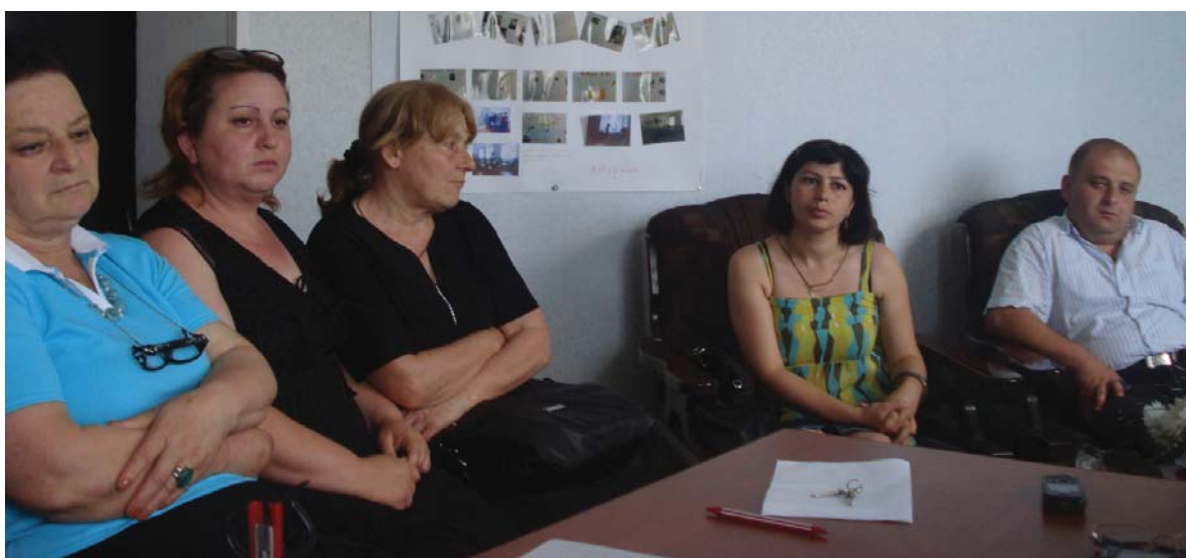
Клуб женщин-избирательниц в Хоби

Думаю, мы, мужчины, должны знать, какие препятствия ожидают женщин во время