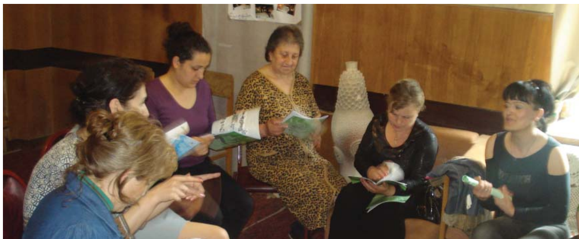
Встреча в Цхалтубо