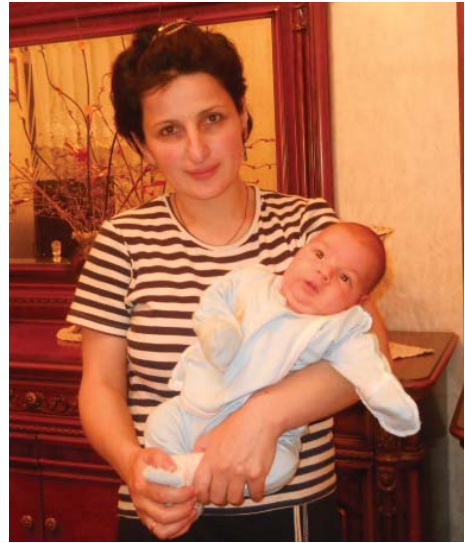
მდგომარეობის გამო იძულებულნი ხდებიან, უარი თქვან შვილის გაჩენაზე“.

...აღნიშნული ინიციატივა სერიოზული სტიმული გახდება იმ ქალებისათვის, რომლებიც არ მუშაობენ და ოჯახების მძიმე სოციალური