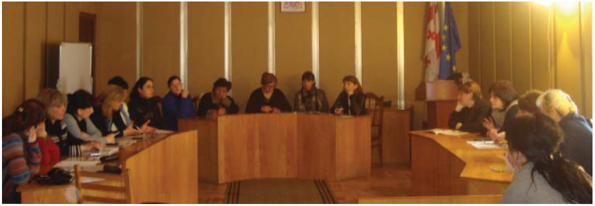
ამომრჩეველ ქალთა კლუბი ოზურგეთის საკრებულოში შეიკრიბა