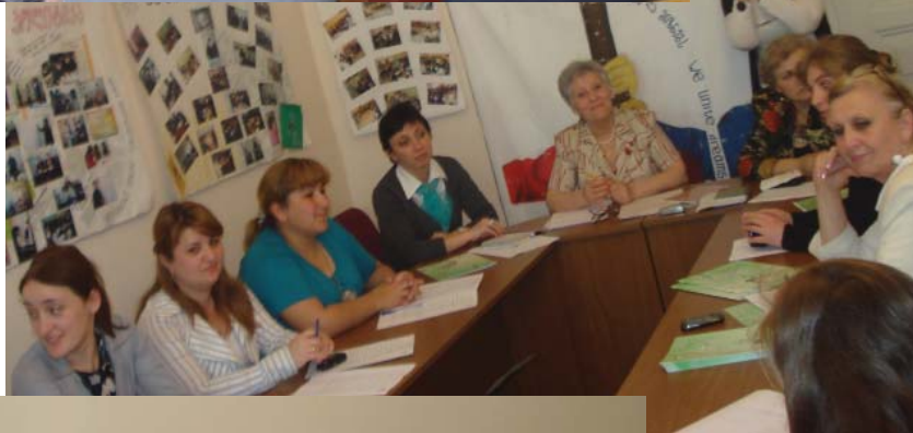
გაცვლითი შეხვედრა ქუთაისში