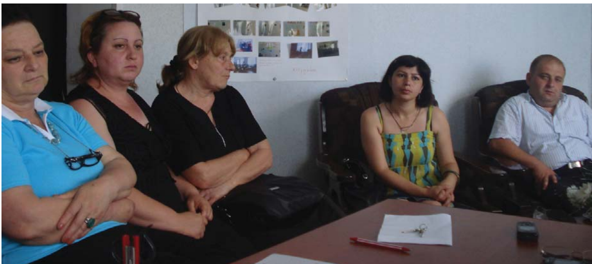
ამომჩიველ ქალთა კლუბი ხობში