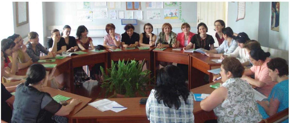
გაცვლითი შეხვედრა ზუგდიდში