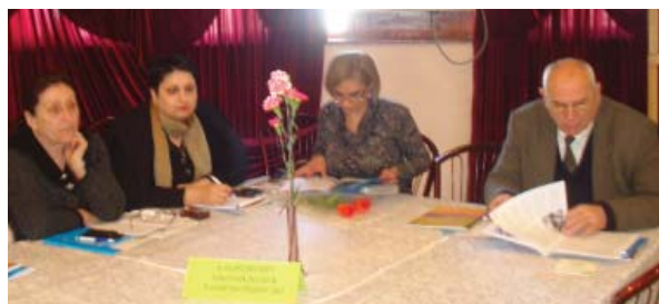
ჭეუფი „იურისტები, ადვოკატები, ფსიქოლოგები“

პრევენციისას ხაზი გაესვა მედიის გააქტიურებას, ჟურნალისტური ეთიკის, პროფესიონალიზმის, მსხვერპლთა კონფიდენციალობის დაცვას. პასუხისმგებლობა დააკისრეს ცენტრალურ და ადგილობრივ ხელისუფლებას, შესაბამის სამინისტროებს (შრომის, ჯანმრთელობის და სოციალური დაცვის, ეკონომიკის, განათლების), არასამთავრობო სექტორს, კერძო პირებს.“